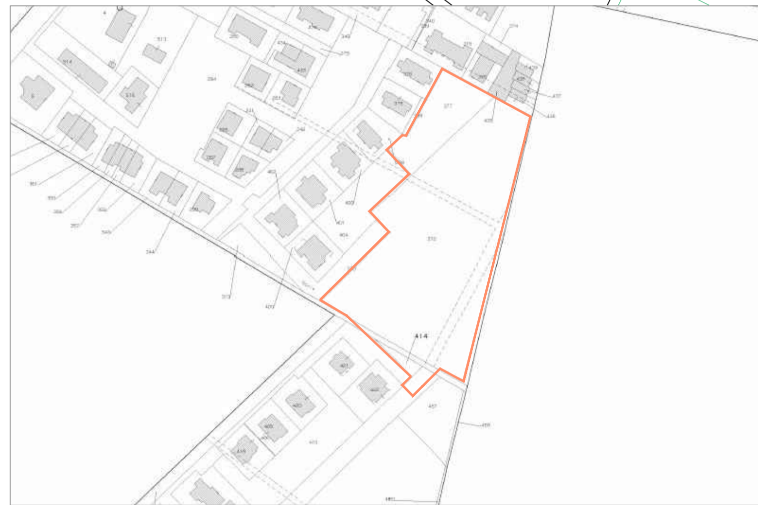
Cartografia catastale - Foglio 227 Mapp. 414, 372, 377

"RICHIESTA DI PUA DI INIZIATIVA PRIVATA" PROGETTO PER LA REALIZZAZIONE DI UN COMPLESSO RESIDENZIALE PREVISTO A FERRARA ALL'INTERNO DELLA VIA MARIO DOTTI