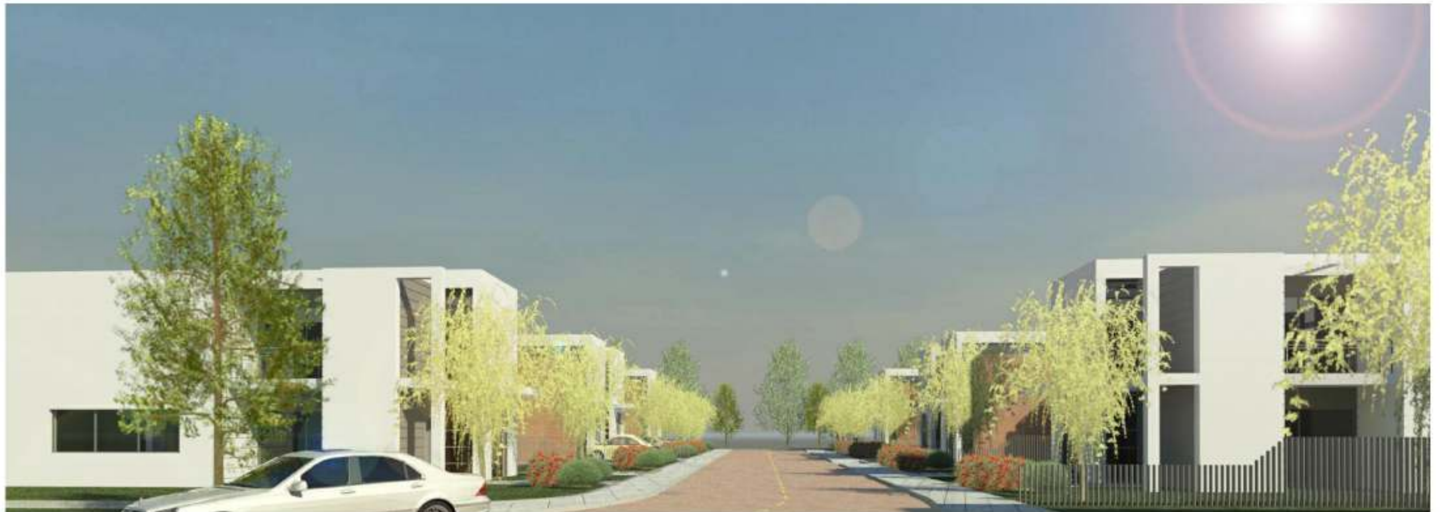
Elaborazione grafica esemplificativa del viale privato