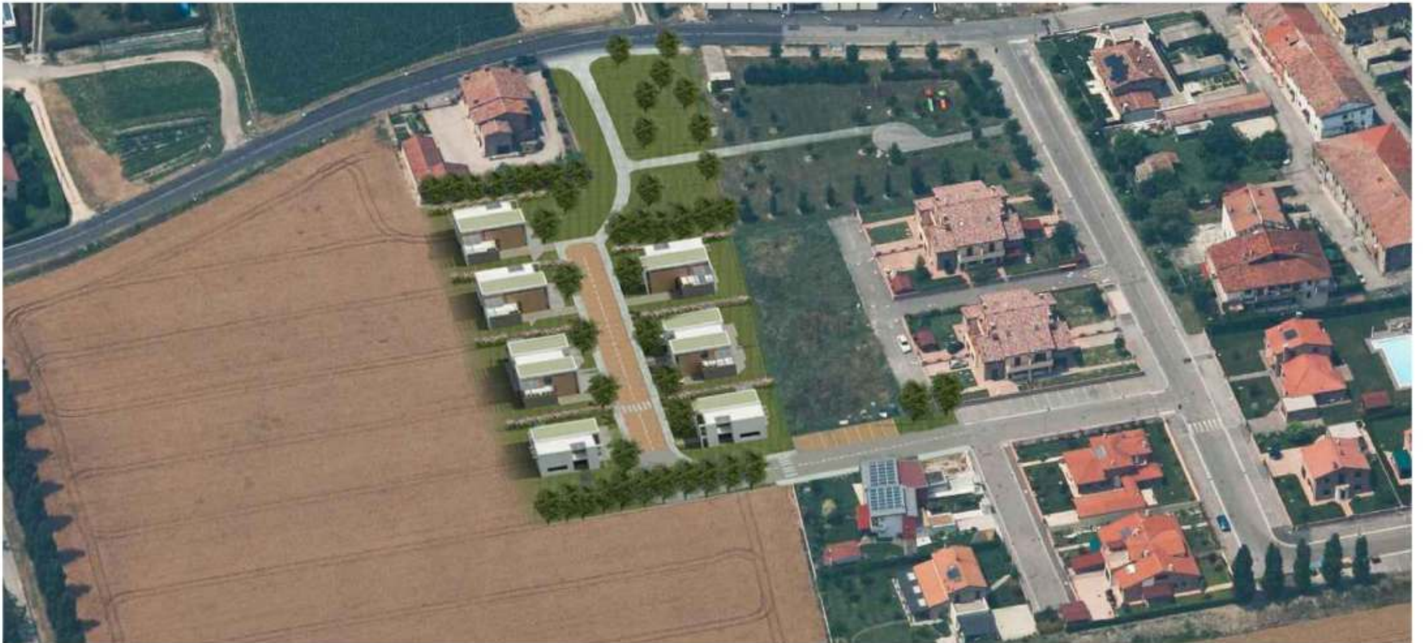
Elaborazione grafica vista dall'alto - lato EST