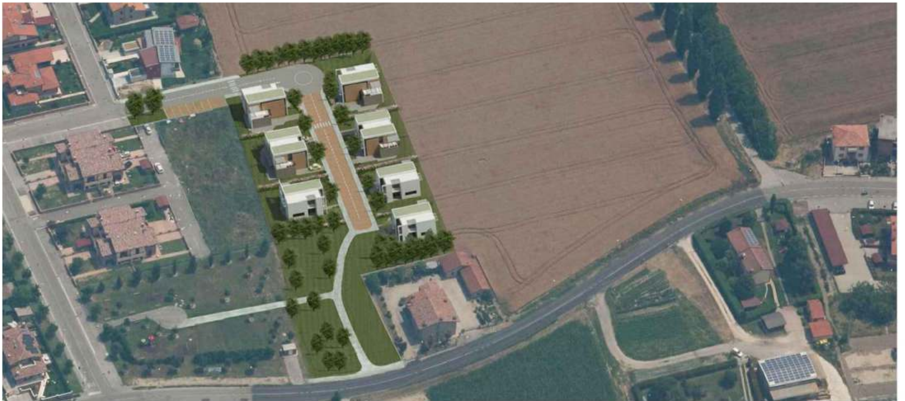
Elaborazione grafica vista dall'alto - lato OVEST