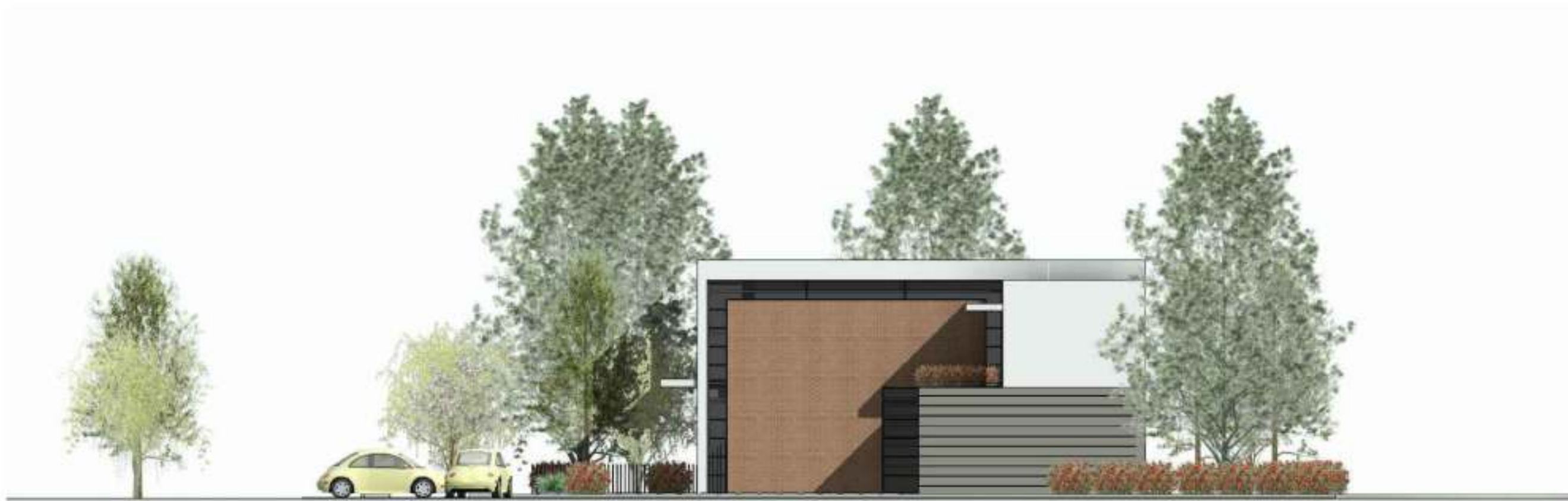
Elaborazione grafica esemplificativa del fronte prospettico orientato ad ovest