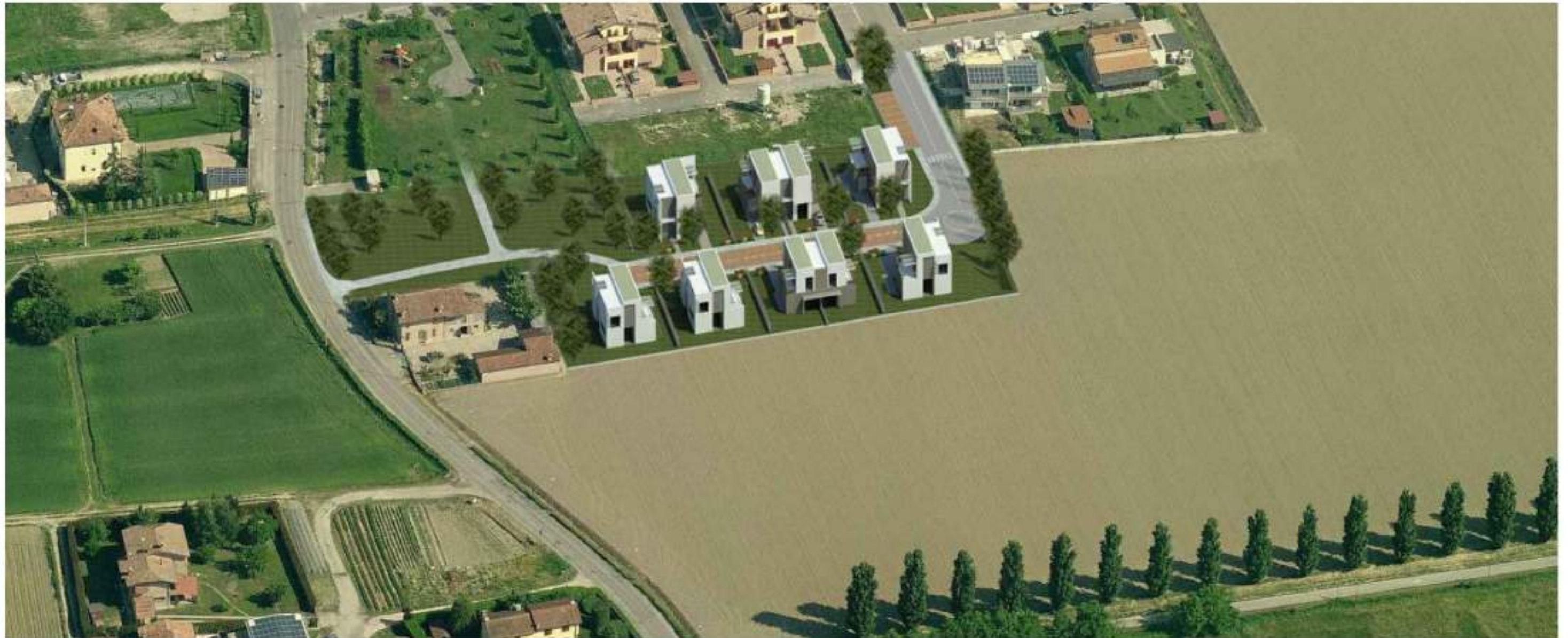
Elaborazione grafica vista dall'alto - lato OVEST