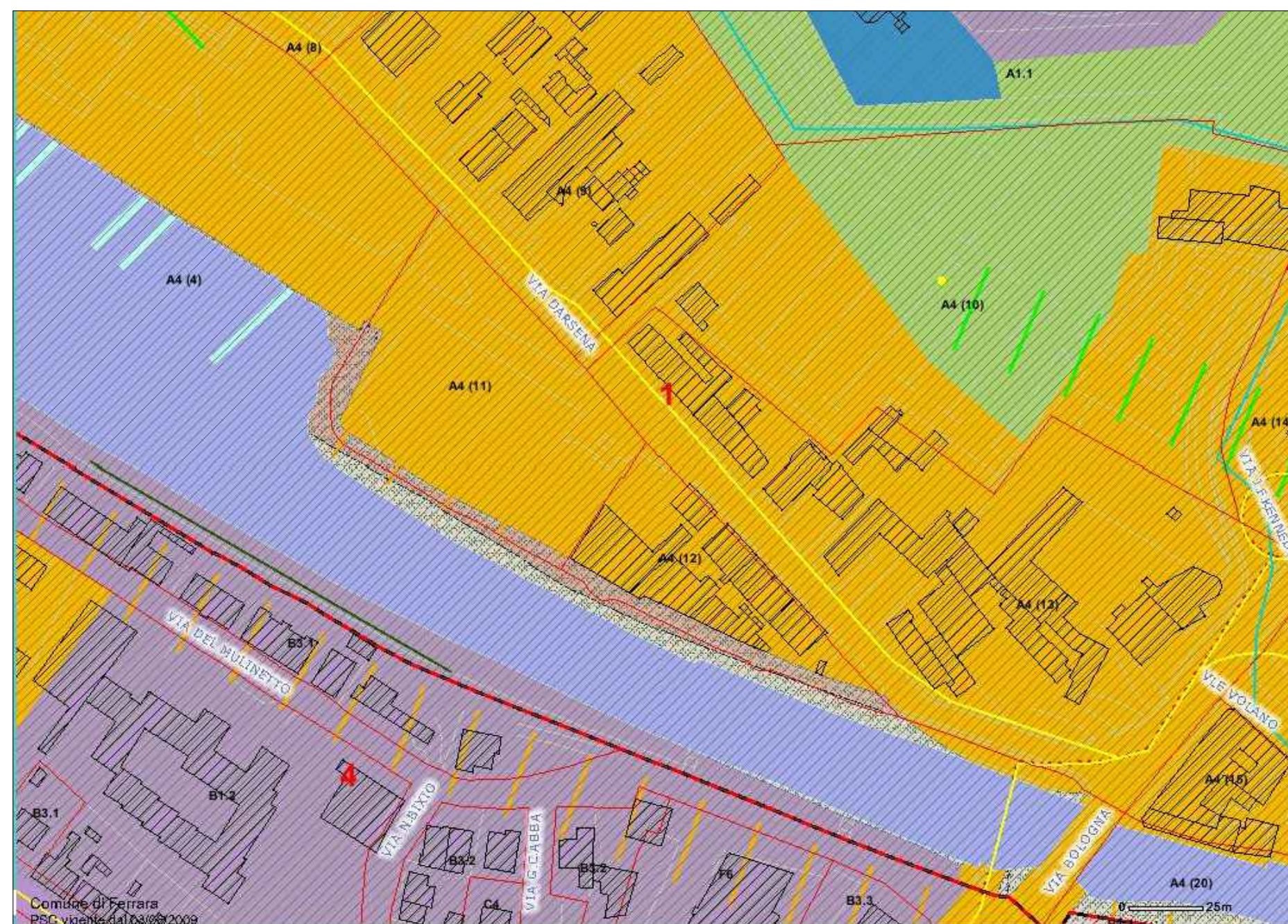
ESTRATTO CARTOGRAFICO - PSC DI FERRARA