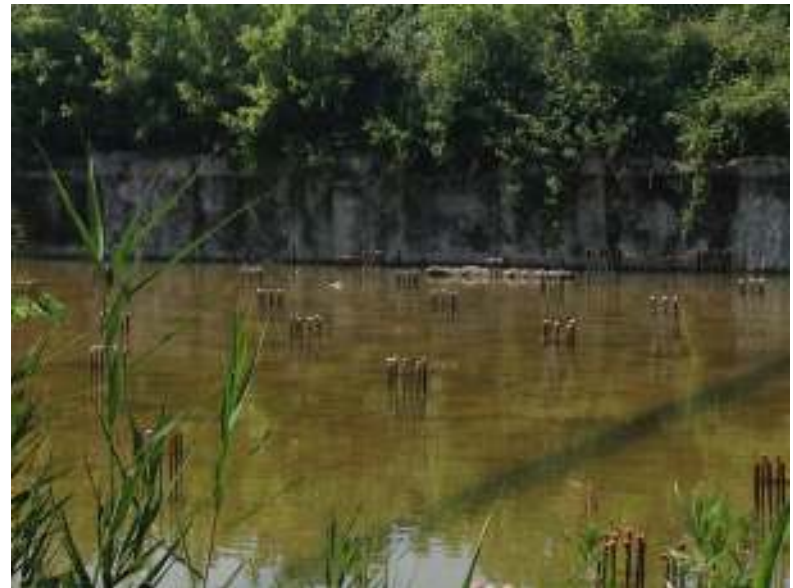
VISTA 07. Vista del piano interrato da destinare a parcheggio.