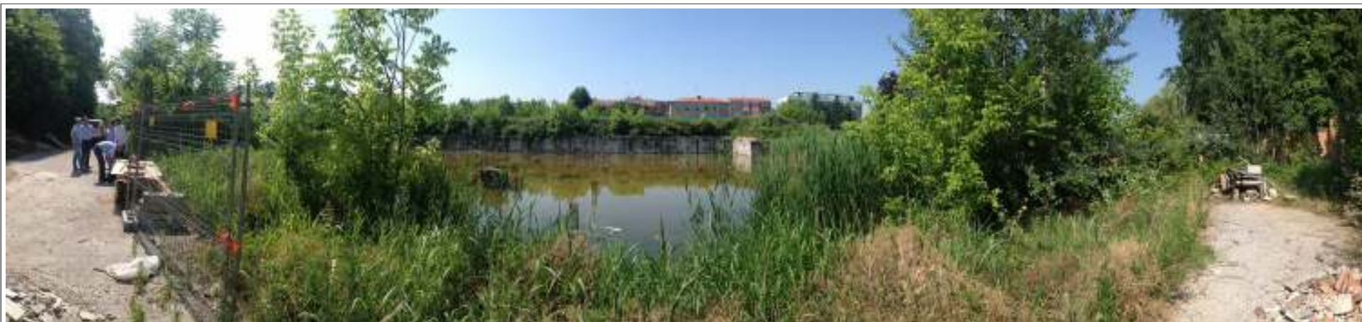
VISTA 02. Vista del piano interrato da destinare a parcheggio.