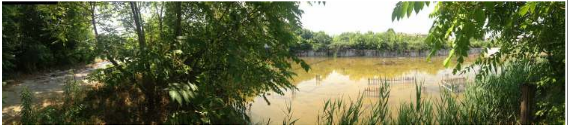
VISTA 05. Vista del piano interrato da destinare a parcheggio.