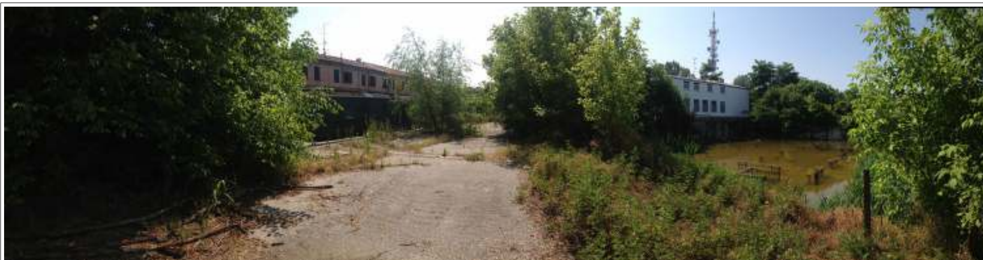
VISTA 04. Vista della strada tangente longitudinalmente al piano interrato da destinare a parcheggio.