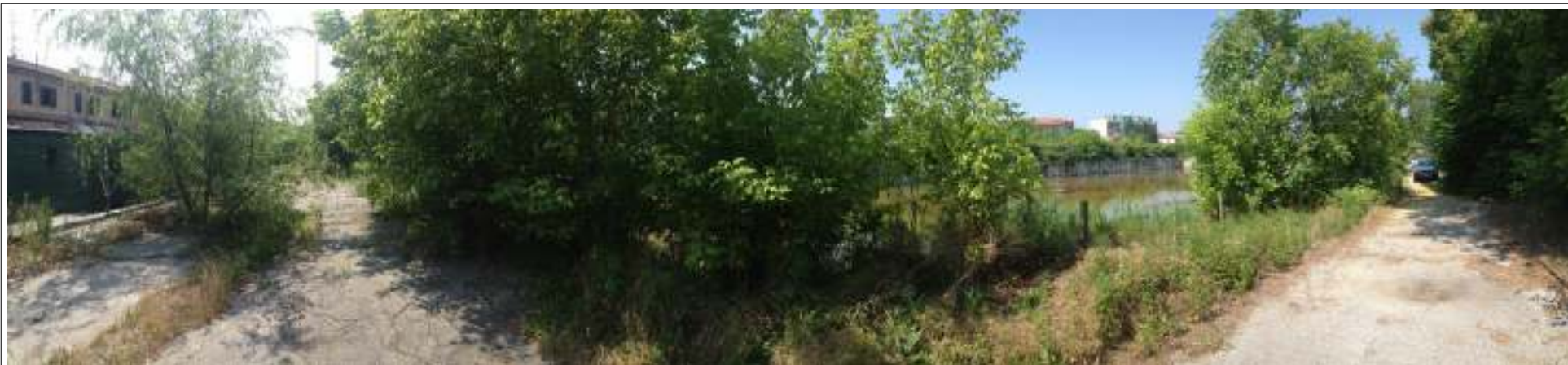
VISTA 03. Vista della strada tangente longitudinalmente al piano interrato da destinare a parcheggio.