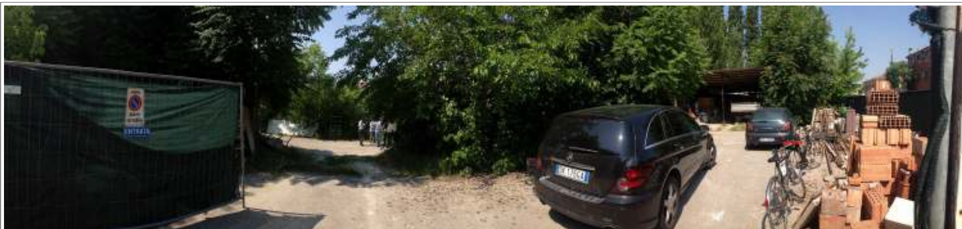
VISTA 01. Ingresso attuale all'area di intervento.