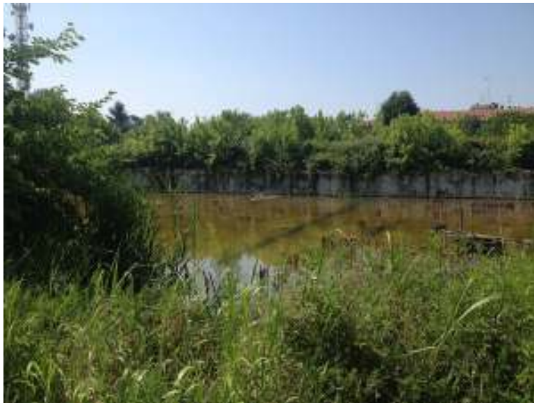
VISTA 06. Vista del piano interrato da destinare a parcheggio.