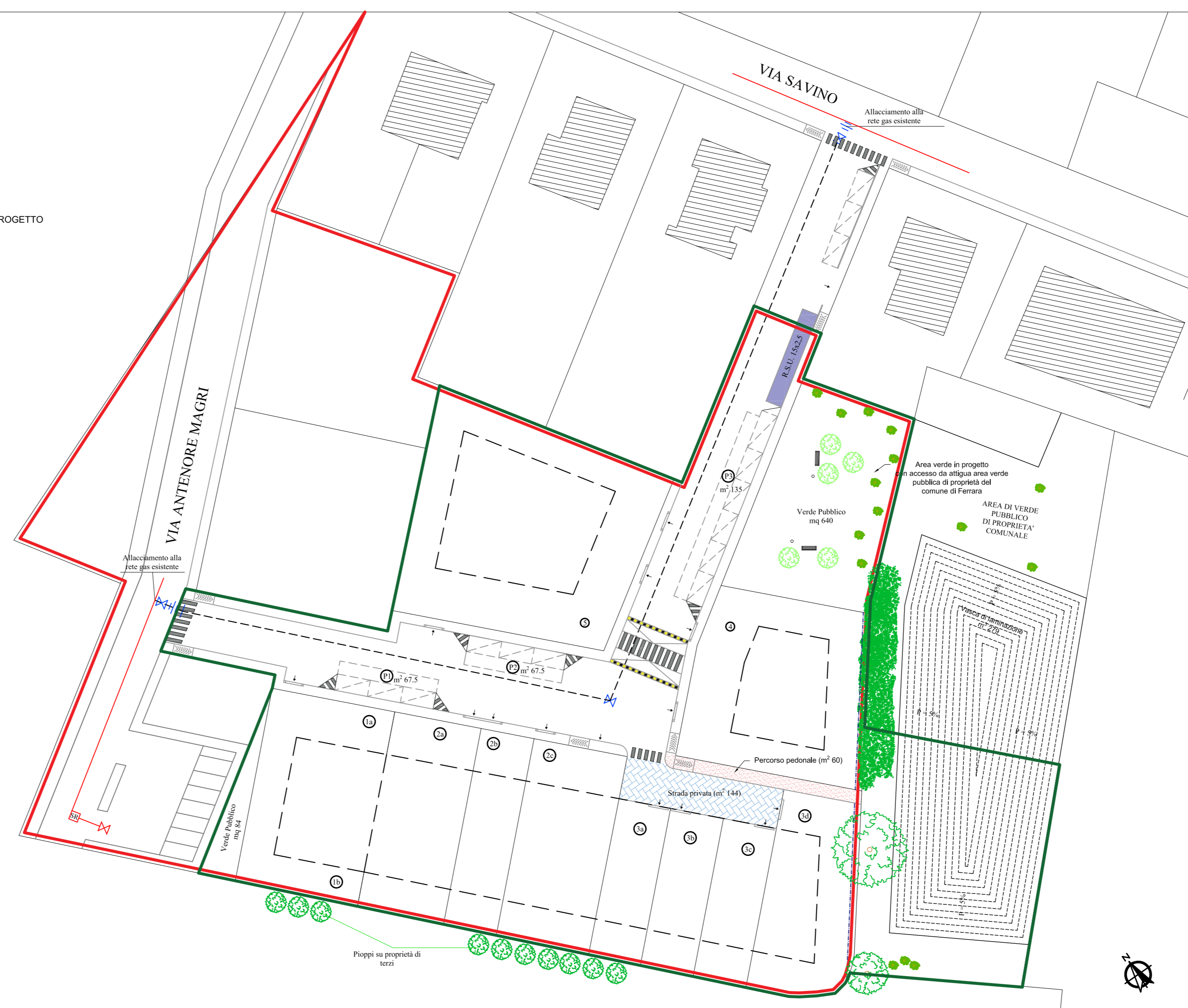
ESTRATTO DI MAPPA Fg.195 mapp. 2495,2496,2497,2498,2499,2500