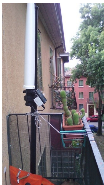
Stazione tribanda PMM8057 FUB

Nelle figure sotto sono rappresentate le due tipologie di centraline utilizzate nel progetto.