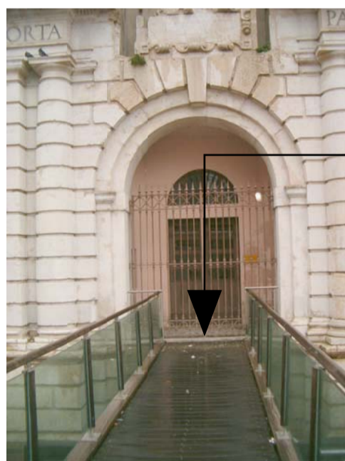
CAPOSALDO DI RIFERIMENTO