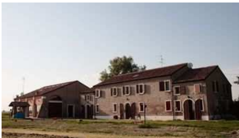
La casa famiglia e a sinistra il fienile